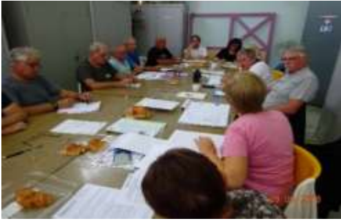
Les amis réunis échangent leurs expériences