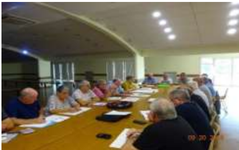
De MIMIZAN à Limoges, un débat enrichissant

Et le 20 septembre, c'était la réunion régionale qui se tenait à MORCENX pour traiter de la situation et en tirer des pistes d'actions et activités à soumettre au C.A.N. de la C.A.V.A.M. du 17 octobre prochain.