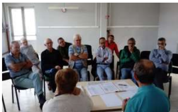
Des amis attentifs aux explications

Un moment de la discussion a porté sur l'importance d'accompagner les contaminés, malades ou ayants droit de décédés devant les tribunaux pour soutenir les demandeurs, se faire voir et entendre, ainsi apporter la preuve au tribunal que nous sommes tous concernés. (L'humain d'abord !!)