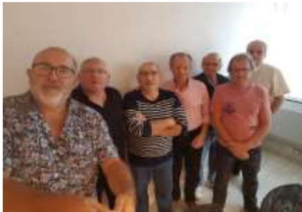
La commission nationale éradication à la fin de sa réunion ...

... du 4 septembre où il a été largement question du projet de « pilote éradication » de BERGERAC avec évolution industrielle. La CAVAM suit ce projet avec beaucoup d'attention.